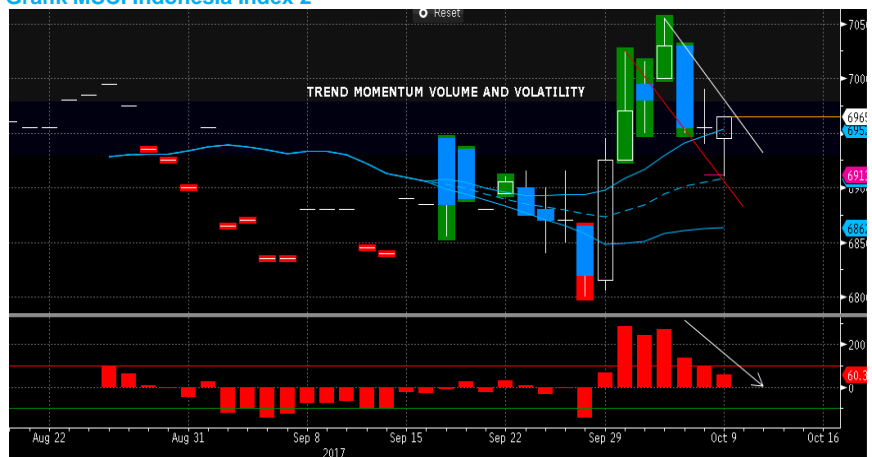
Grafik MSCI Indonesia Index 2

Dari domestik, rilis data penjualan ritel pada hari ini akan mempengaruhi pergerakan MSCI Indonesia Index. Sentimen berikutnya adalah realisasi penerimaan pajak sampai dengan September baru mencapai sekitar 60% dari target pajak yang harus dikumpulkan pada akhir tahun 2017. Dilihat secara fundamental, MSCI Indonesia Index akan bergerak terbatas pada perdagangan hari ini.