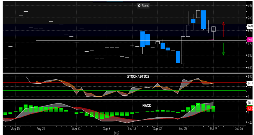
Grafik MSCI Indonesia 1