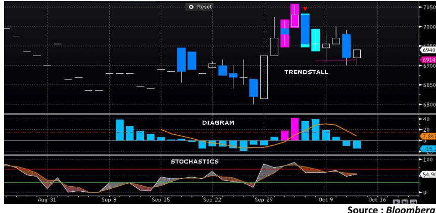
Grafik MSCI Indonesia 1